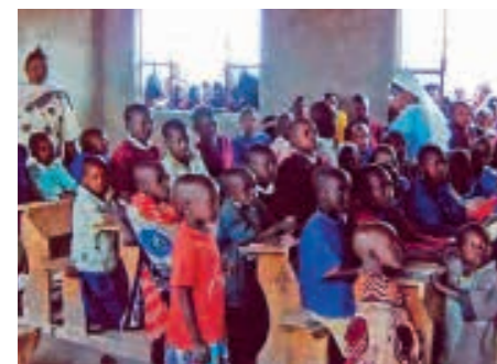
Eine Schulklasse in der Diözese Arusha