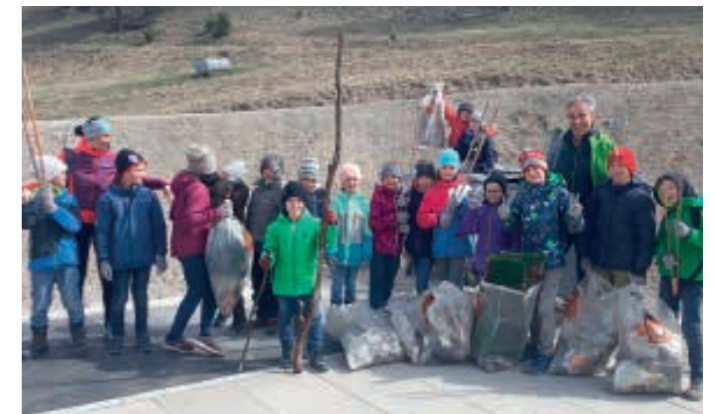
3. und 4. Klasse mit der eingesammelten „Beute“ am Ziel der Sportplatzterrasse.

Die Agrargemeinschaft Patsch bedankt sich für die tatkräftige Unterstützung bei allen fleißigen Helferinnen und Helfern! (Bernhard Haller für die Agrargemeinschaft)