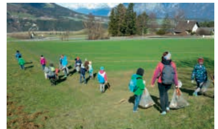
Bei Föhnsturm ging es querfeldein durch Patsch.