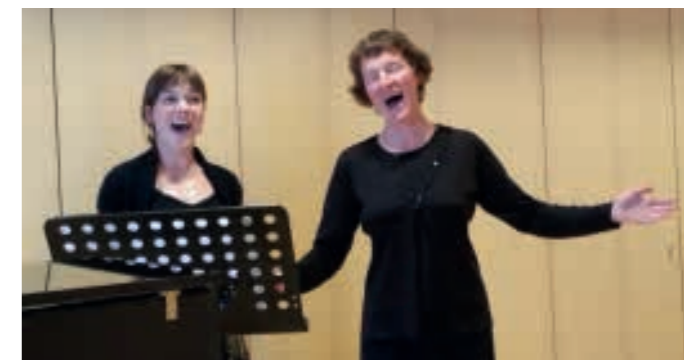
Die beiden stimmungsgewaltigen Sängerinnen überzeugten mit mehreren Duetten. Den Abschluss des Konzertes bildete das lustige Stück für zwei Katzen von Gioacchino Rossini.