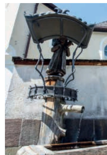
Foto des entfernten Brunnens am Eingang des alten Friedhofs, Tiroler Tageszeitung 2015.