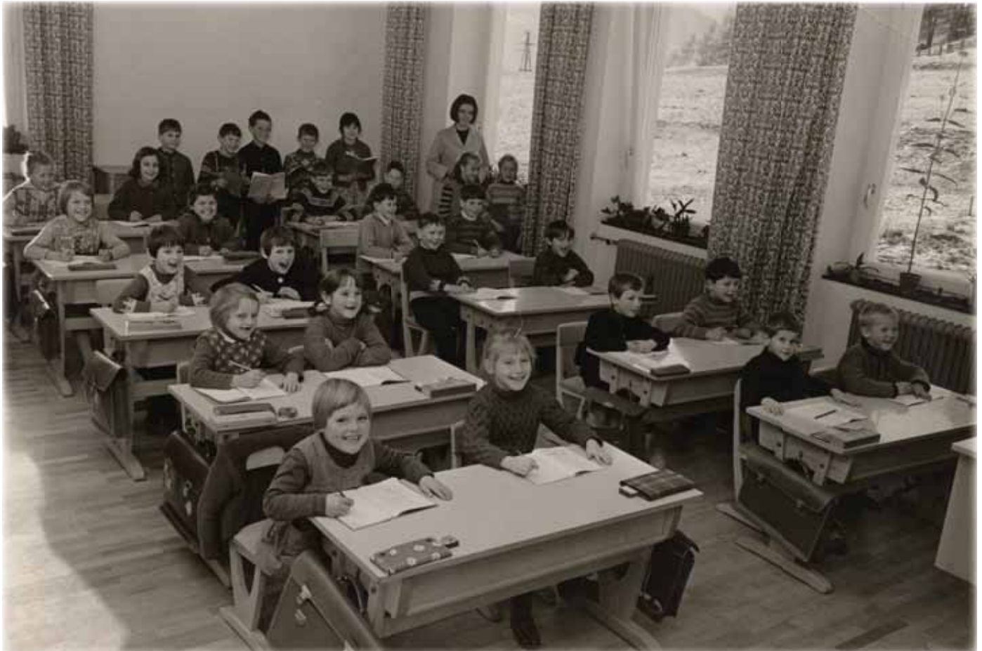
Klassenfoto, Aufnahme von 1967

Linke Sitzreihe: (von links nach rechts)